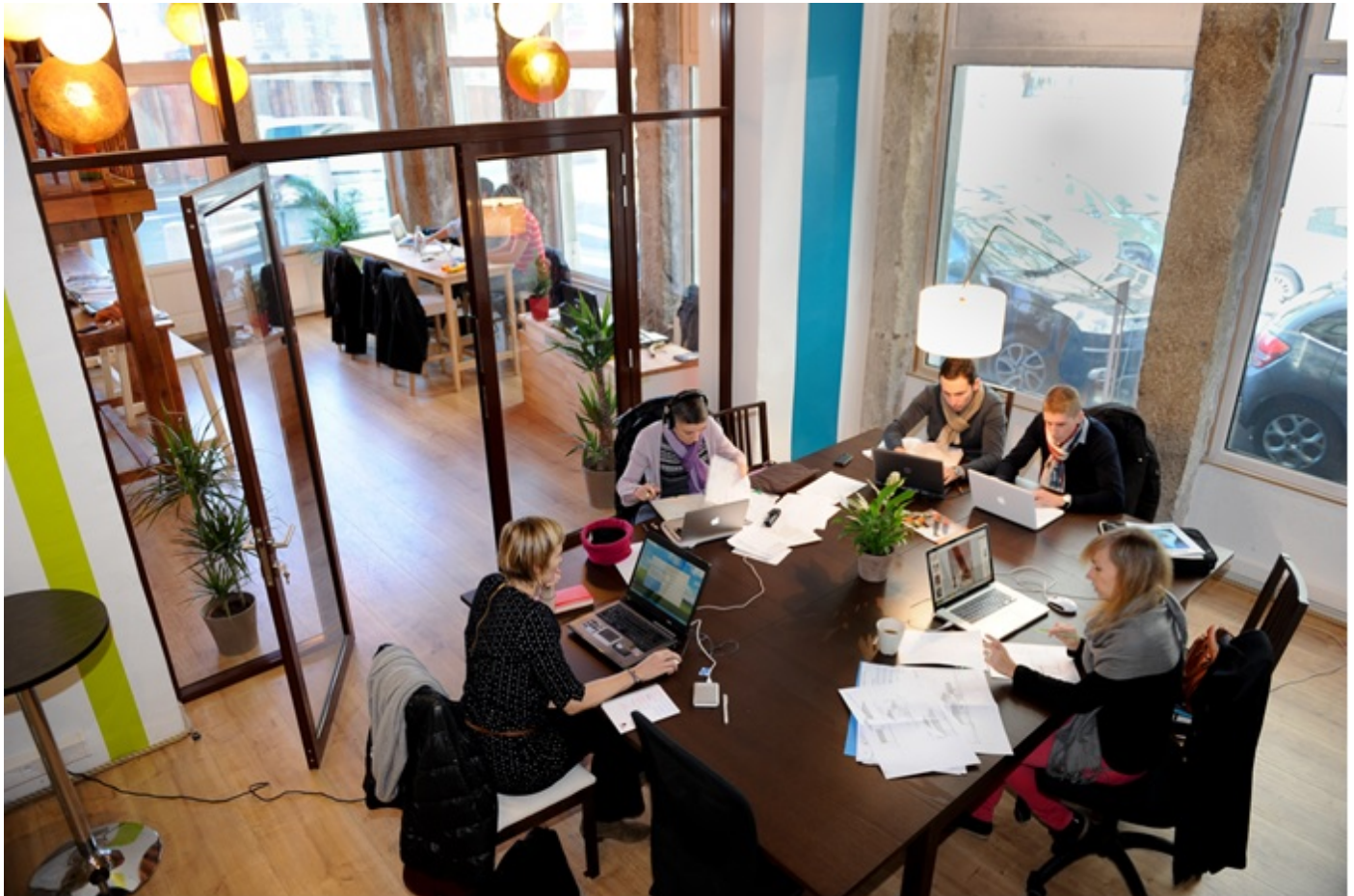
Exemple du lieu de travail partagé disponible à la Cordée Perrache, Lyon

L'externalisation de nombreuses fonctions au sein des entreprises entraîne un important développement de l'entrepreneuriat individuel. Ces nouveaux actifs indépendants, de plus en plus nombreux, en particulier dans les filières du numérique , de l' information et de la communication cherchent à partager des ressources (lieu de travail, connexion en très haut débit, matériel), à rompre avec l'isolement lié au travail à domicile et à enrichir leurs compétences, leurs savoir-faire et leurs carnets d'adresses au contact de leurs pairs. De nouveaux lieux d'échange et de coopération se développent pour répondre à ces besoins. Ces lieux de travail partagés sont souvent appelés espaces de coworking .